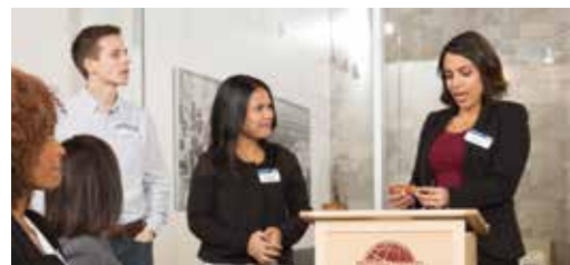
Table Topics (Stegreifreden). Während der Table Topics haben alle Teilnehmer die Gelegenheit, ein bis zwei Minuten lange, improvisierte Reden zu halten. Dies ist häufig der herausforderndste und unterhaltsamste Teil Ihres Clubtreffens.

Die Reihenfolge und die Länge dieser Segmente kann von Club zu Club unterschiedlich sein. Die Länge eines Clubtreffens bestimmt häufig die Zeitdauer für jedes Segment.